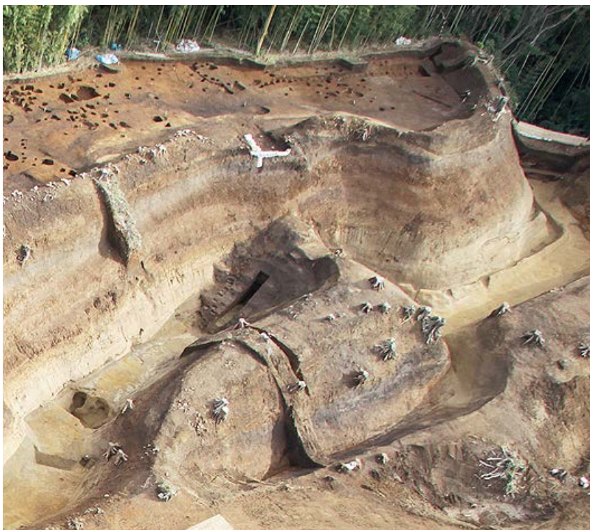
土塁・虎口部分の拡大

本城北側の土橋(d)は、江戸時代以降に造られたものです。戦国時代の大手(城の正面)は本城西側で、中城方向から土塁(e)の上を通り、虎口(こぐち)(f)から本城に入りました。土塁と虎口には高低差があるので、橋または階段を使っていたと思われます。