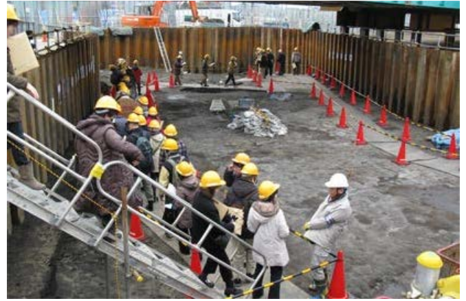
階段を下りて当時の地表へ