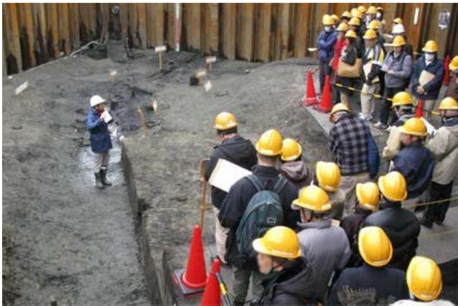
調査員による詳細説明