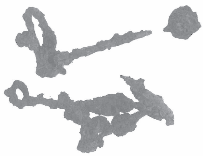
轆 処理前 ¼