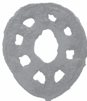
鍔 処理後 1/2