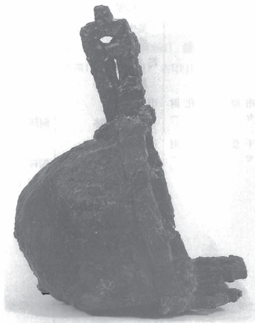
鎧 処理後 1/3

欠損部分を発泡ウレタンで補填してあったものを、ダイナミックレジン (エポキシ系補填材)に置き換え、同系色とした。