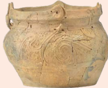
縄文土器 (縄文時代、成田市山口雷土遺跡)