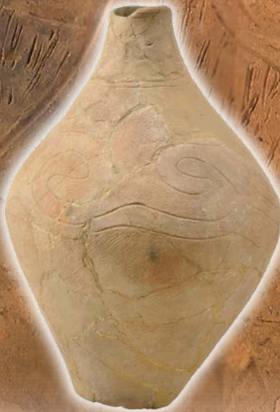
弥生再葬墓の壺(大多喜町船子遺跡)