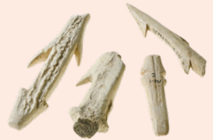
各地の銚頭 (縄文時代)