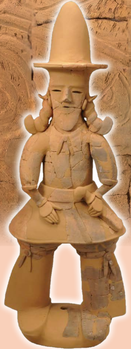
あごひげの埴輪(千葉市人形塚古墳)