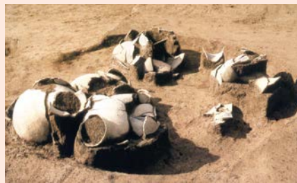
再葬墓 (弥生時代、多古町埜台遺跡)