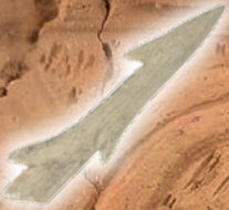
鋌頭(成田市荒海貝塚)