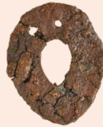
2円窓付き鏝 (古墳時代、山武市胡摩手台16号墳)