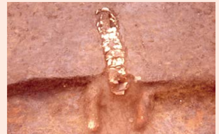
長煙道カマド (平安時代、袖ヶ浦市永吉台遺跡群西寺原地区)