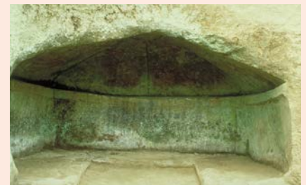
高壇式横穴 (古墳時代、茂原市山崎横穴群)