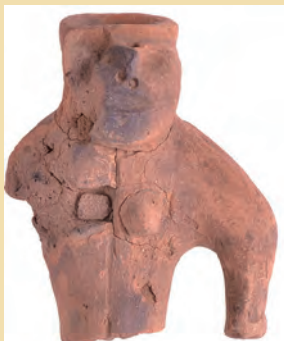
飯積原山遺跡出土 土偶