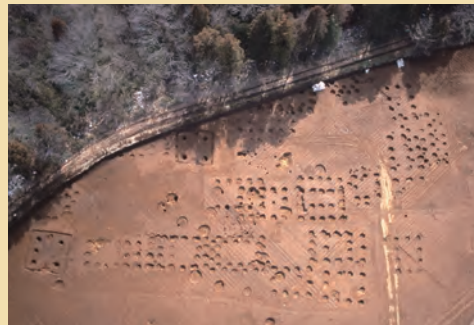
上…飯積原山遺跡 建物群 下…飯積原山遺跡出土 人面ヘラ描き土製支脚