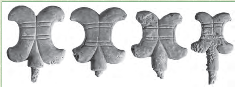
▲石神2号墳出土 かじられた痕跡のある立花

東寺山石神遺跡は千葉市若葉区東寺山町の東京湾に注ぐ都川下流に合流する葭川の台地縁辺部に位置します。当遺跡は1975年に発掘調査を実施しており、古墳5基・竪穴住居跡3軒が見つかりました。特に遺存状態が良かったのが古墳時代中期の東寺山石神2号墳です。東寺山石神2号墳は直径25mほどの円墳で、墳頂部に割竹形木棺が設置されてい