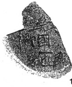
写真3 下総国匝瑳郡玉作郷 匝瑳市信濃台遺跡出土墨書土器(註15 文献より転載)