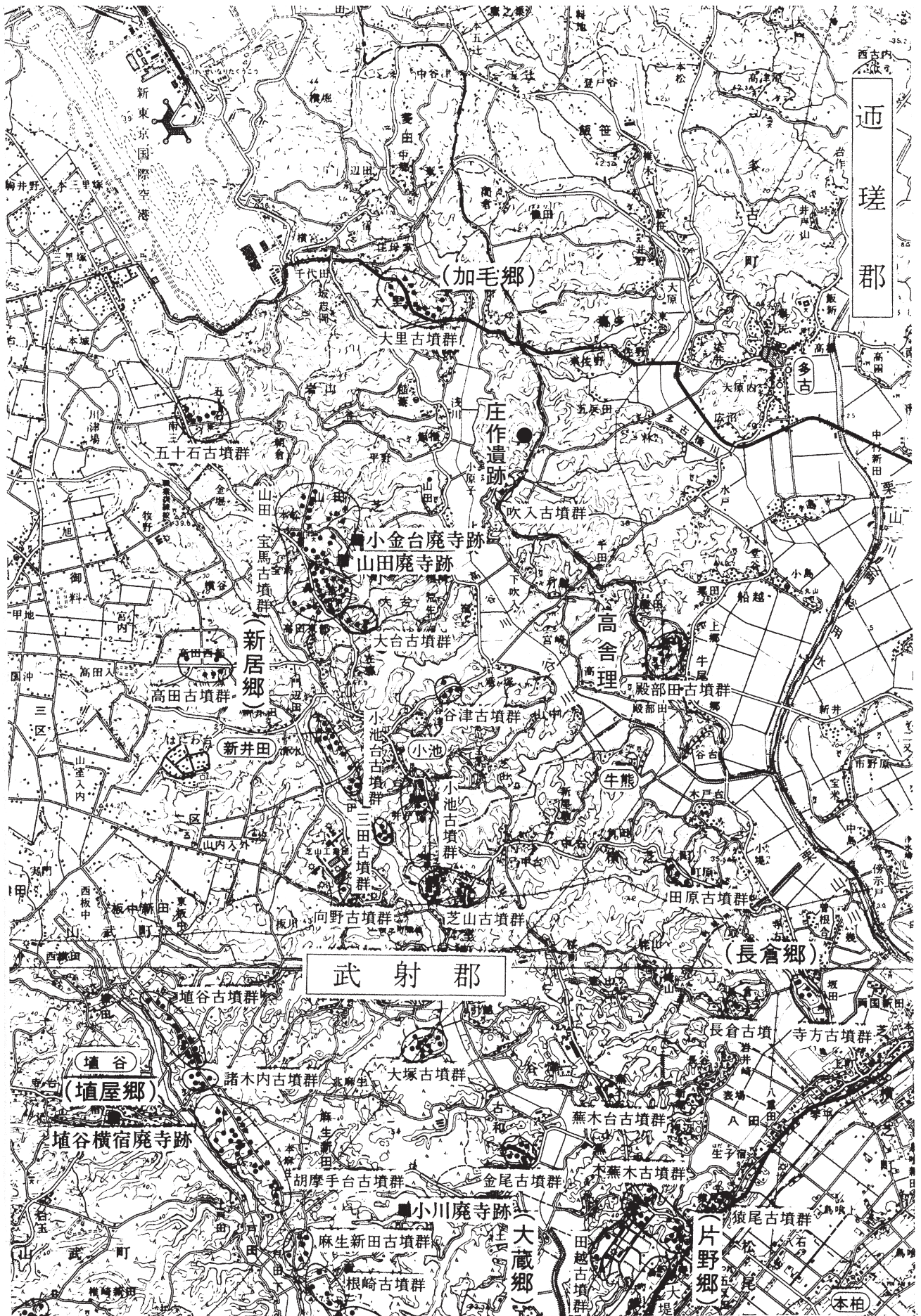
図2 上総国武昌郡高舎里位置図 (註14 文献より転載一部改変)