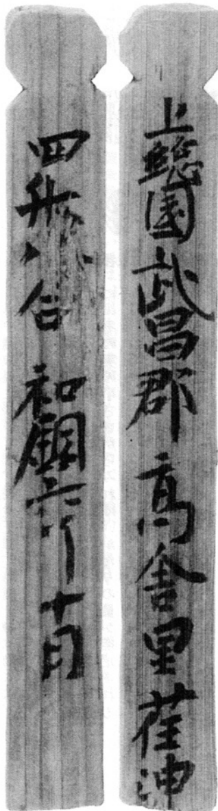
写真1 平城京二条大路大溝跡出土「上総国武昌郡高舎里」記載木簡(註2 文献より転載)