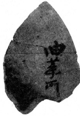
写真2 上総国分僧寺跡出土墨書土器(註9 文献より転載)