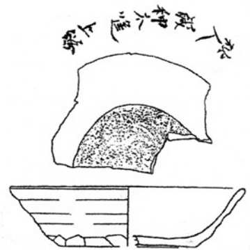
図1-2 芝山町庄作遺跡出土墨書土器(註16 文献より転載)